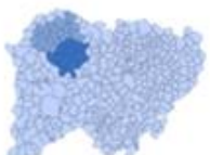
Tierra de Vitigudino